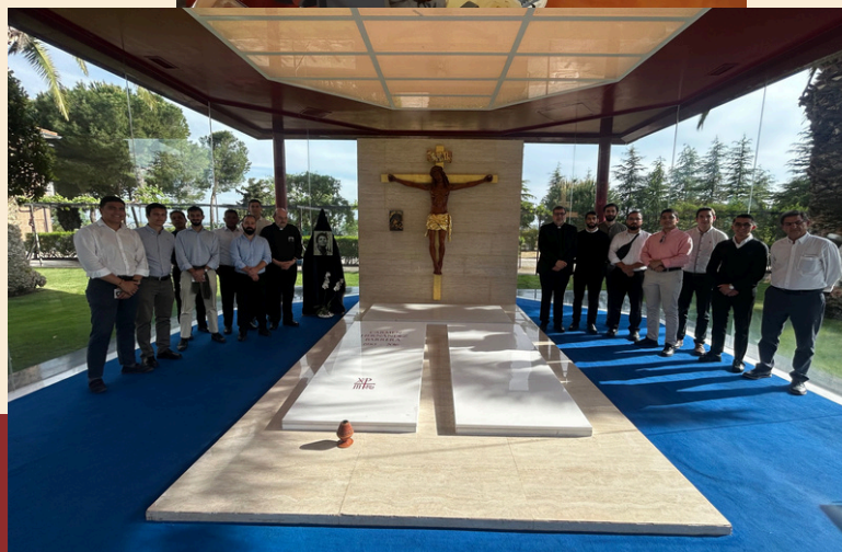
Santuario de la Palabra SRM de Madrid