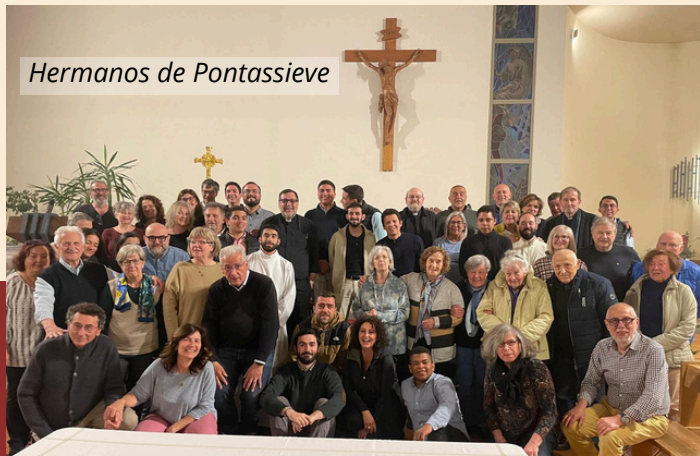
Hermanos de Pontassieve

Celebramos la Eucaristía con los hermanos de Pontassieve (Italia). Con ellos hemos compartido días de verdadera comunión, en los que hemos podido experimentar la paz y la alegría de Cristo.