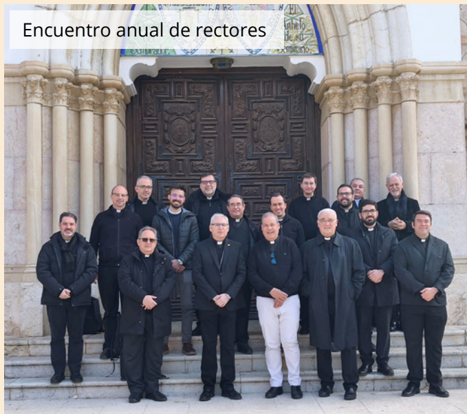
Encuentro anual de rectores