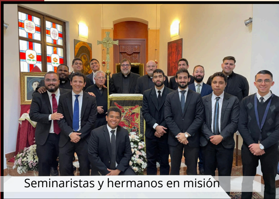
Seminaristas y hermanos en misión

"La Comunión se trata de juntar dos extremos: Dios, que lo es todo, y la criatura, que es nada; Dios, es luz, y la criatura, que es tiniebla; Dios, que es la santidad, y la criatura, que es el pecado. Trátase de sentarse a la mesa del Señor, ¿y puede haber para ello preparación suficiente?" (Santa Gema Galgani)