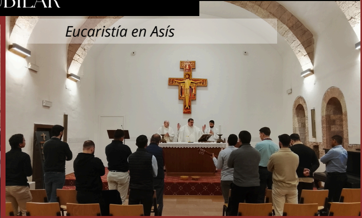
Eucaristía en Asís