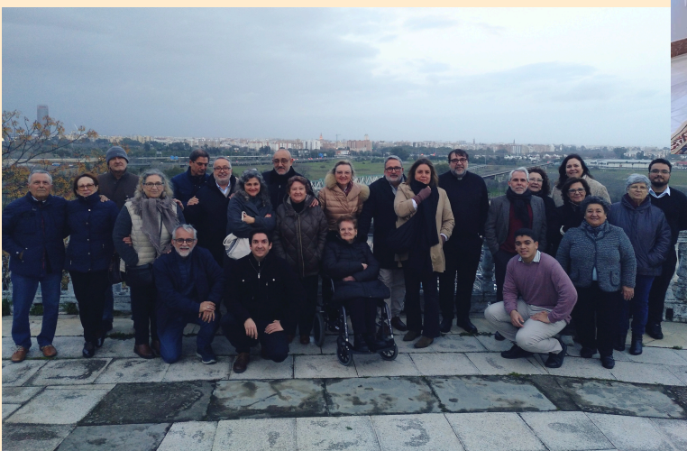
1ª comunidad de San Pablo