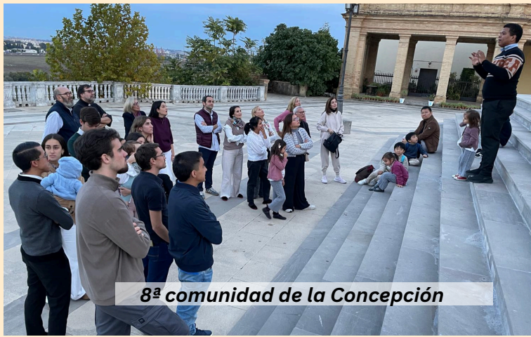
8ª comunidad de la Concepción

La llamada al sacerdocio de los seminaristas ha nacido en las Comunidades Neocatecumenales. Su visita al seminario les hace presente el origen de su vocación, a la vez que la alientan y sostienen con su presencia y su oración.