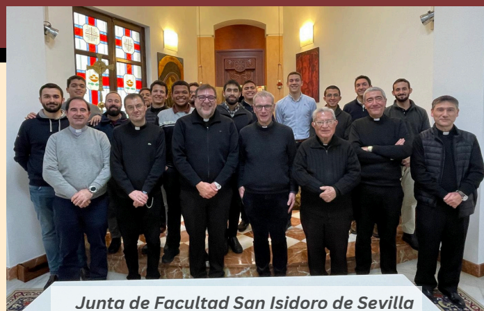
Junta de Facultad San Isidoro de Sevilla