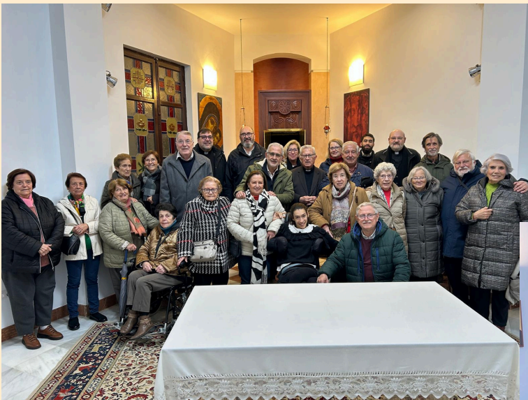
1ª comunidad de la Concepción

Es muy importante para nuestro seminario la visita de las comunidades. Aquí os mostramos un testimonio grafico de los hermanos que nos han visitado en este tiempo