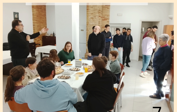
Grupo de niños de San Gonzalo