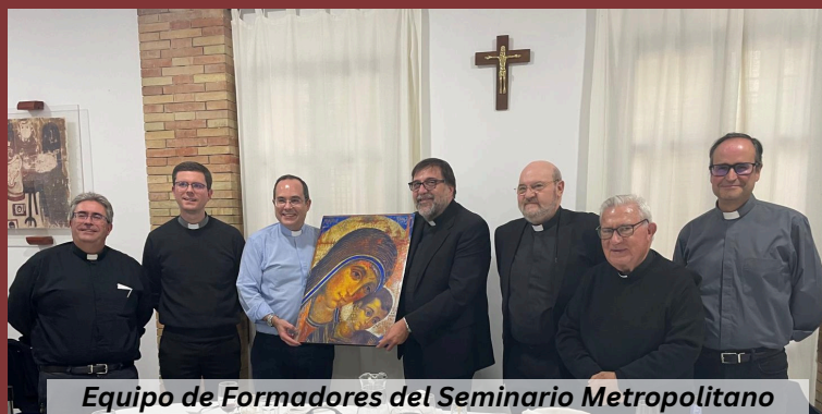
Equipo de Formadores del Seminario Metropolitano