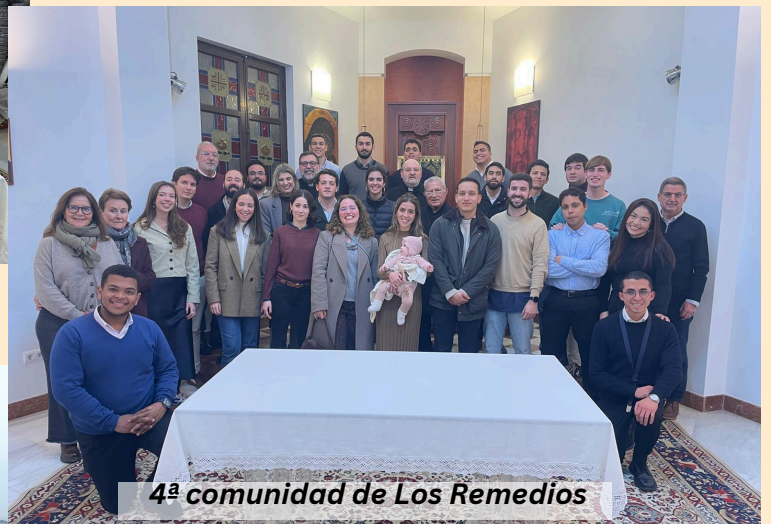
4ª comunidad de Los Remedios

Es muy importante para nuestro seminario la visita de las comunidades. Aquí os mostramos un testimonio grafico de los hermanos que nos han visitado en este tiempo