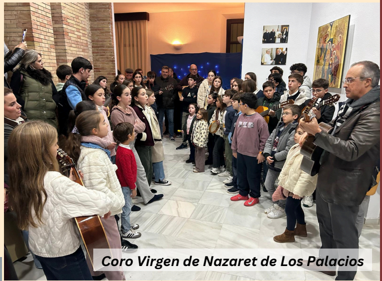
Coro Virgen de Nazaret de Los Palacios